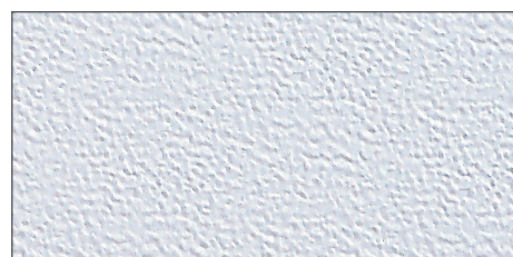
stucco mit allen Oberflächen kombinierbar außer classico