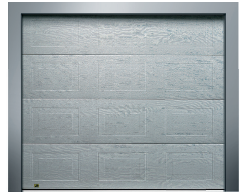
classico (nur in woodgrain)